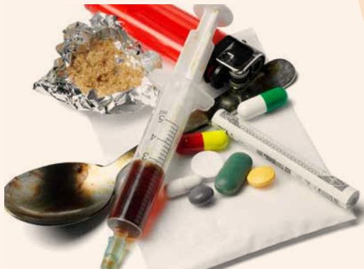
Folder Stoornissen in het gebruik van een middel PCS_Versie 1_Juli 2016

Mensen die drugs gebruiken, willen de effecten van de drugs op het bewustzijn doelbewust ervaren, terwijl medicijnen niet voor die reden worden ingenomen. Weliswaar kunnen er bij sommige medicijnen bewustzijnsveranderende effecten optreden, maar dan worden die effecten beschouwd als 'bijwerkingen'. Daarentegen is het hoofddoel van drugsgebruik om de effecten te ervaren.